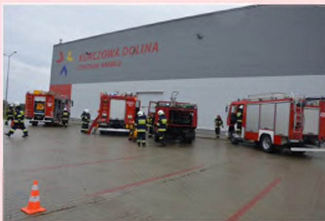
Miejscowość Młyny- manewry powiatowe KSRG