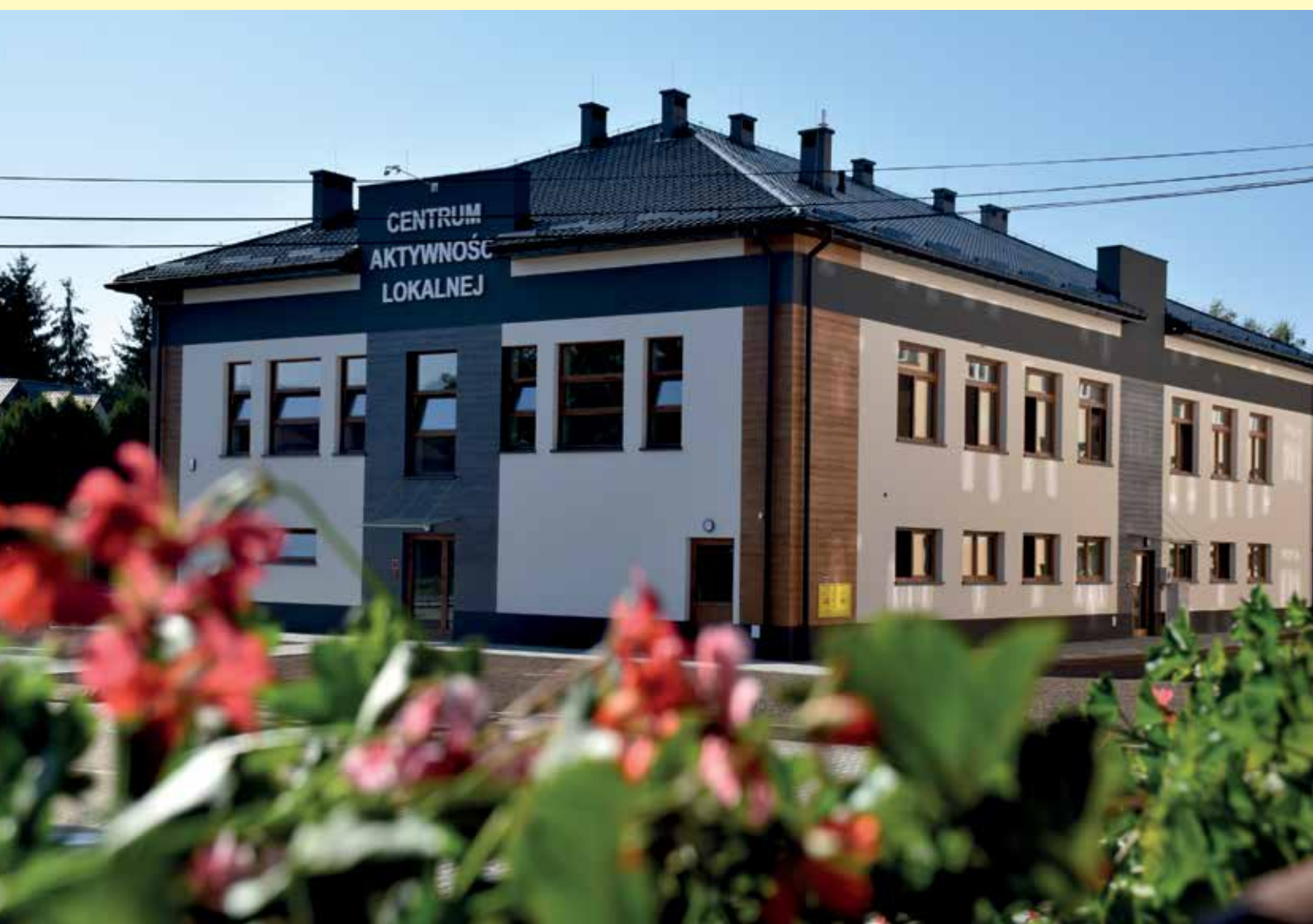
Centrum Aktywności Lokalnej w Pawłosiowie

Urząd Gminy Pawłosiów Pawłosiów 88, 37-500 Jarosław Tel: 16 622 03 80, Fax: 16 622 02 48