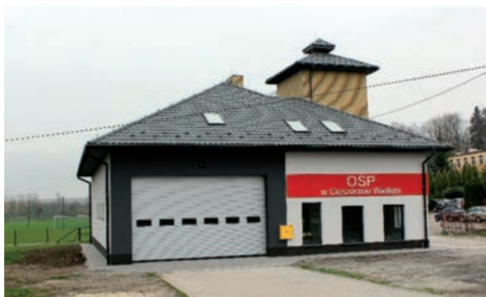
Remiza Strażacka w Cieszynie Wielkim po termomodernizacji