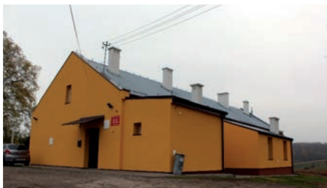
Szkoła Filialna w Kidałowicach po termomodernizacji