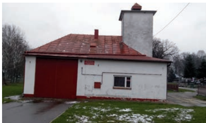
Remiza Strażacka w Cieszynie Wielkim przed termomodernizacją