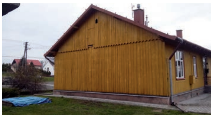
Szkoła Filialna w Ożańsku przed termomodernizacją