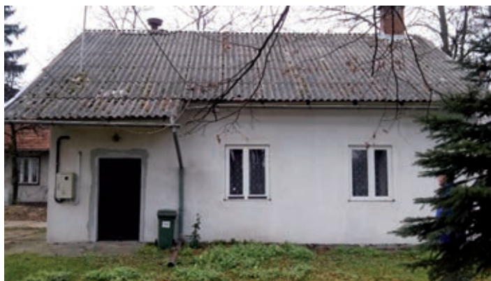
Remiza Strażacka w Tywoni przed termomodernizacją