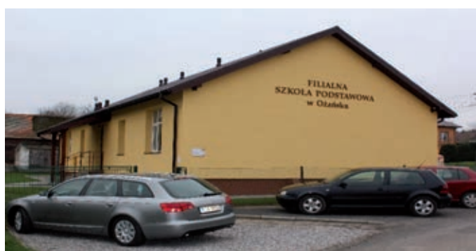
Szkoła Filialna w Ożańsku po termomodernizacji