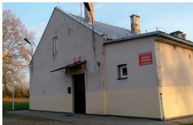
Szkoła Filialna w Kidałowicach przed termomodernizacją

Całkowity koszt inwestycji wyniósł 1,3 mln zł.