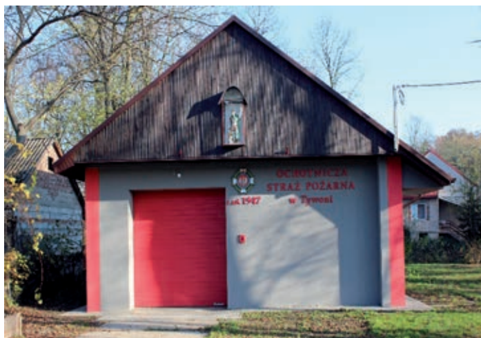
Remiza Strażacka w Tywoni po termomodernizacji