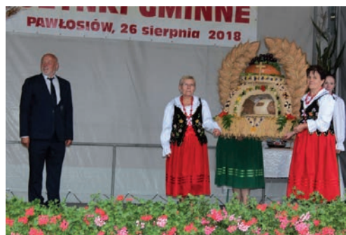
Sołectwo Cieszacin Mały