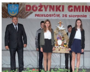
Sołectwo Widna Góra