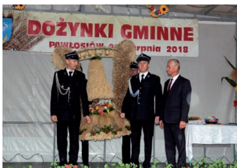
Sołectwo Cieszacin Wielki