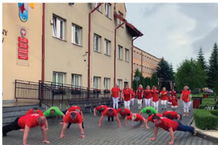
Urząd Gminy w Pawłosowie

mieliśmy czas 48 godzin. Panie również aktywnie włączyły się w wykonanie zadania. Z akcji został nagrany filmik (do obejrzenia na facebooku). Zebrana kwota została przekazana na cele charytatywne.