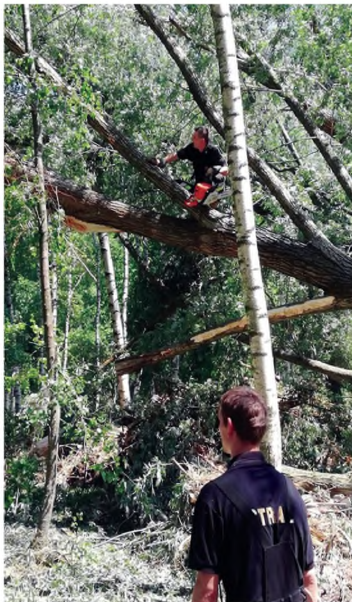
OSP Cieszacin Wielki