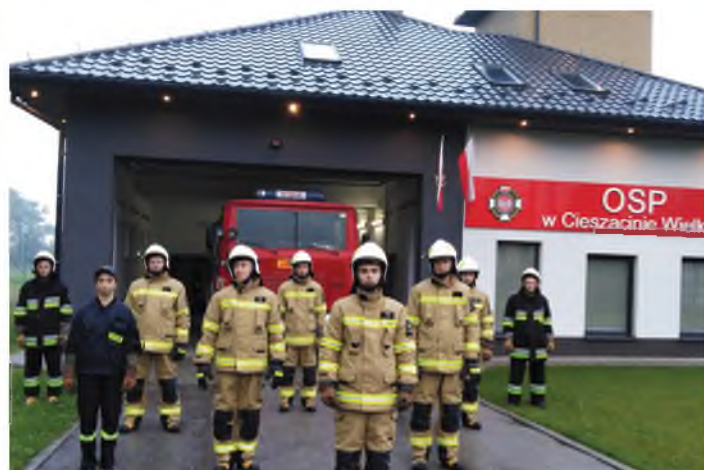
OSP Cieszacin Wielki