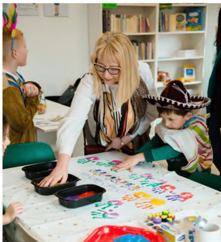
Zajęcia w bibliotece - CAL Pawłosiów

Celem wizyty była wymiana informacji oraz prezentacja efektów wynikających z realizacji projektów sfinansowanych ze środków unijnych pozyskanych w ramach Stowarzyszenia.