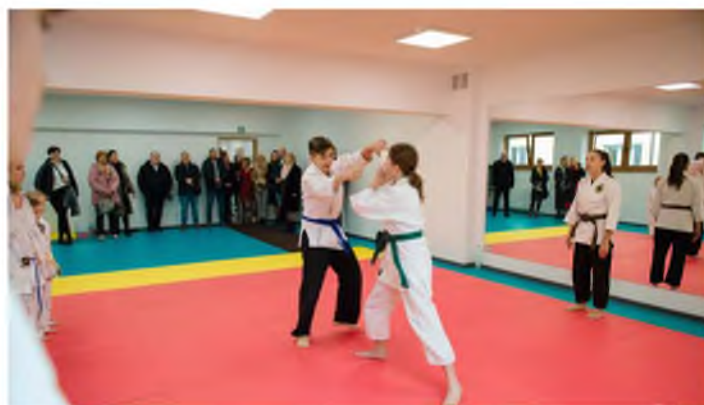
Trening Aikido - Zajęcia w CAL Pawłosiów

Uczestnicy obejrzeli Centrum Kulturalne w Cieszacinie Wielkim, Punkt Selektywnej Zbiórki Odpadów Komunalnych w Wierzbnej, Remizę Ochotniczej Straży Pożarnej w Pawłosiowie wraz z zagospodarowanym obecnie poddaszem oraz zaadaptowany na Centrum Aktywności Lokalnej w Pawłosiowie nieukończony budynek przedszkola.