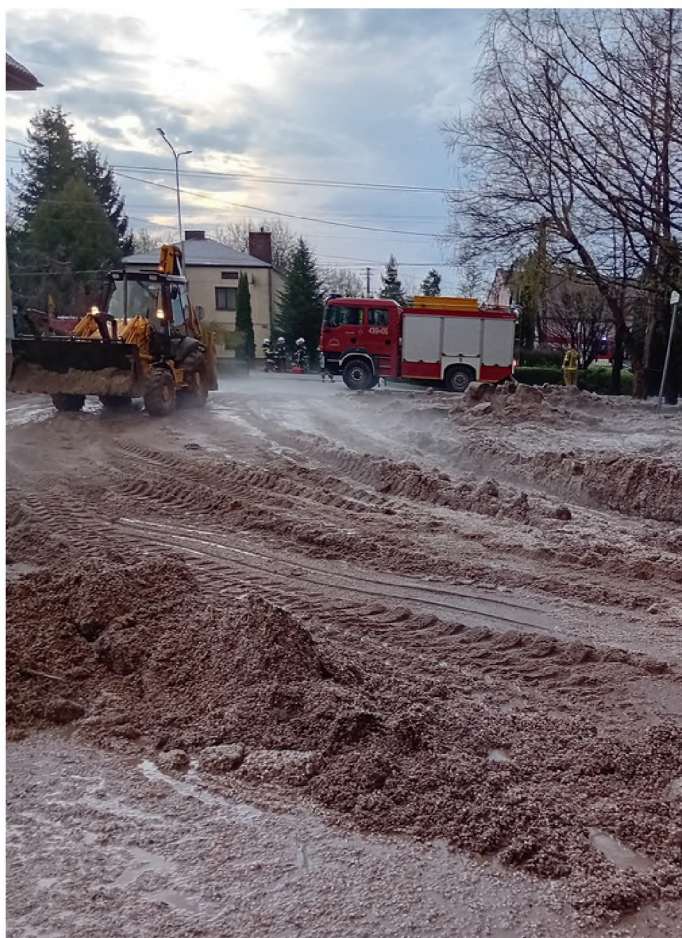
Zalany parking Urzędu Gminy