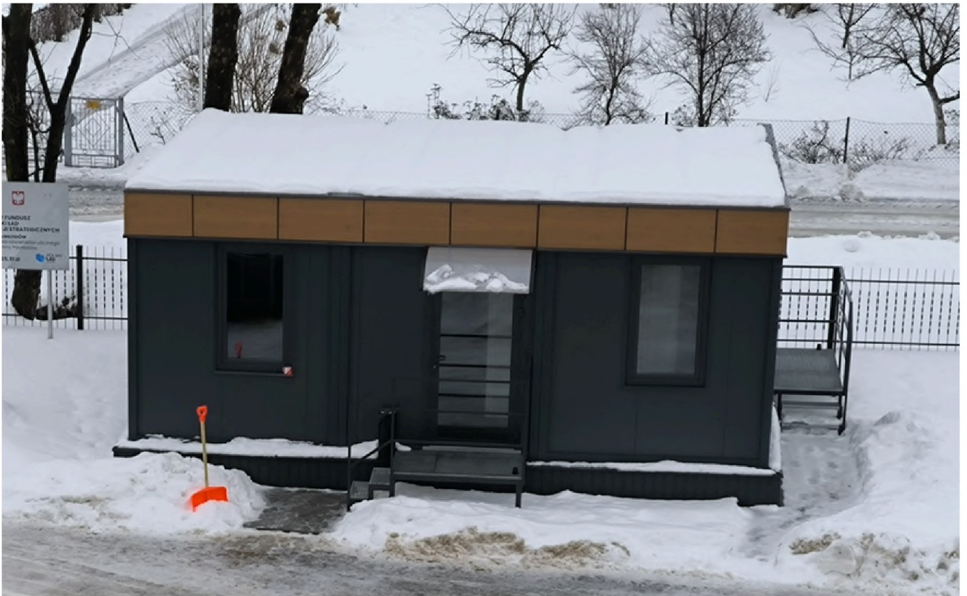
Kontener socjalny dla pracowników UG Pawłosiów realizujących zadania w terenie