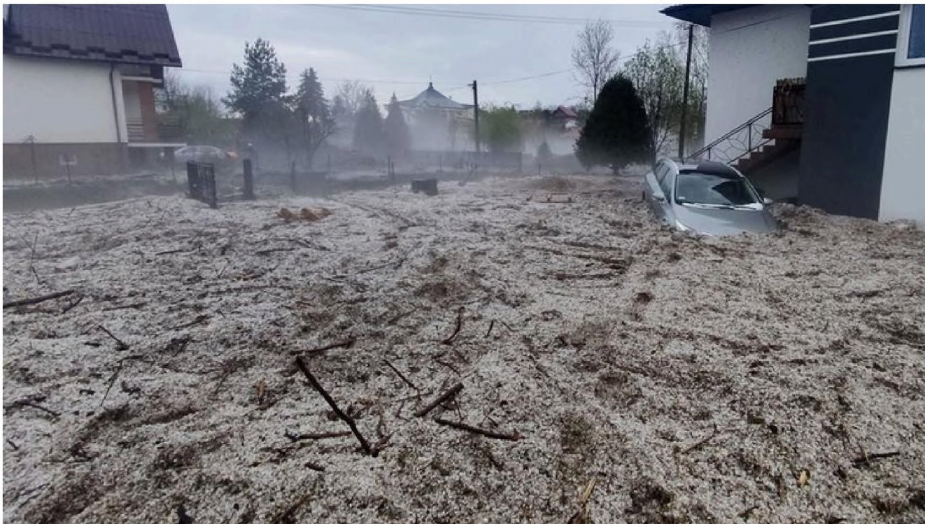
Skala zniszczeń po przejściu żywiołu – na prywatnej posesji widać grubość pokrywy błotnej