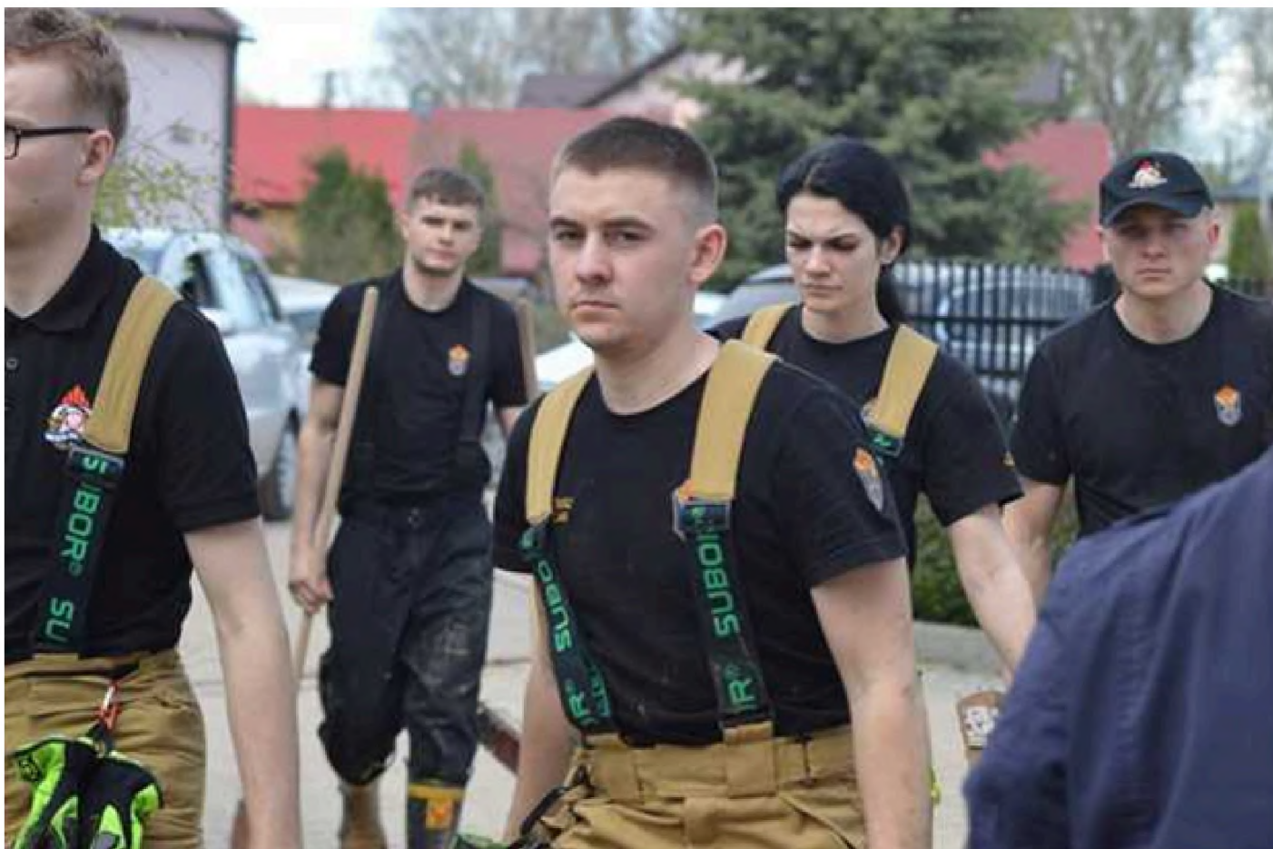
Kadeci ze Szkoły Aspirantów PSP w Krakowie

Prace trwały przez całą noc z 18/19 kwietnia oraz całą Wielką Sobotę do wieczora i zostały przerwane na okres Świąt Wielkanocnych. Na miejscu wspólnie z innymi służbami tj. wojskiem i policją pracowało ponad 200 ratowników. Główny wysiłek skierowano na sprawdzanie stabilności budynków oraz przeszukiwanie tych budynków w celu lokalizacji osób poszkodowanych, wypompowanie wody z zalanych obiektów i piwnic, usuwanie błota z posesji, dróg oraz udrażnianie przepustów, zasilanie agregatami prądotwórczymi obiektów, a także na udzielanie pomocy przy usuwaniu z domostw rozmokniętych mebli oraz sprzętu codziennego użytku.