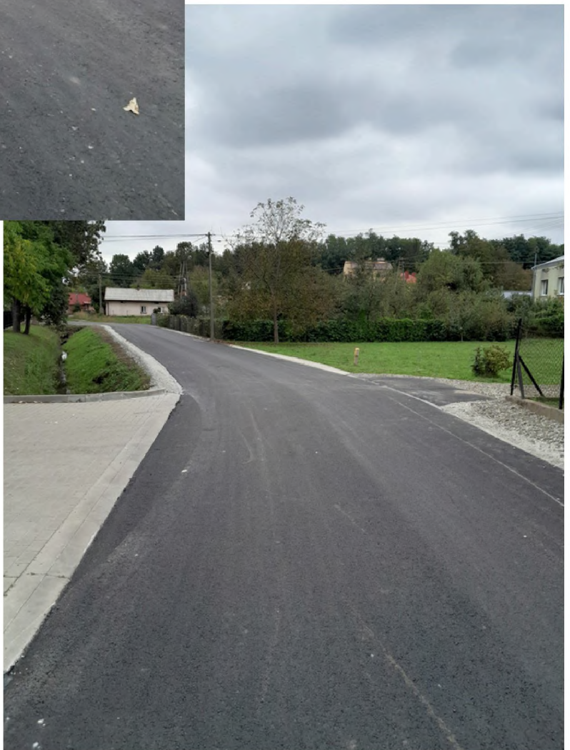
Efekty konsekwentnych działań inwestycyjnych