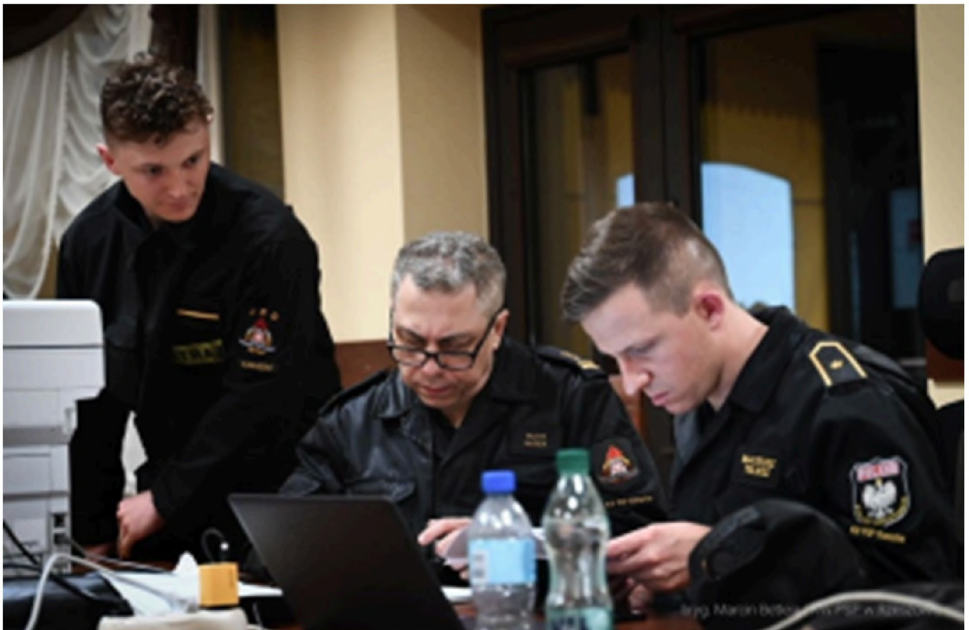
Przekładanie decyzji na zadania w terenie