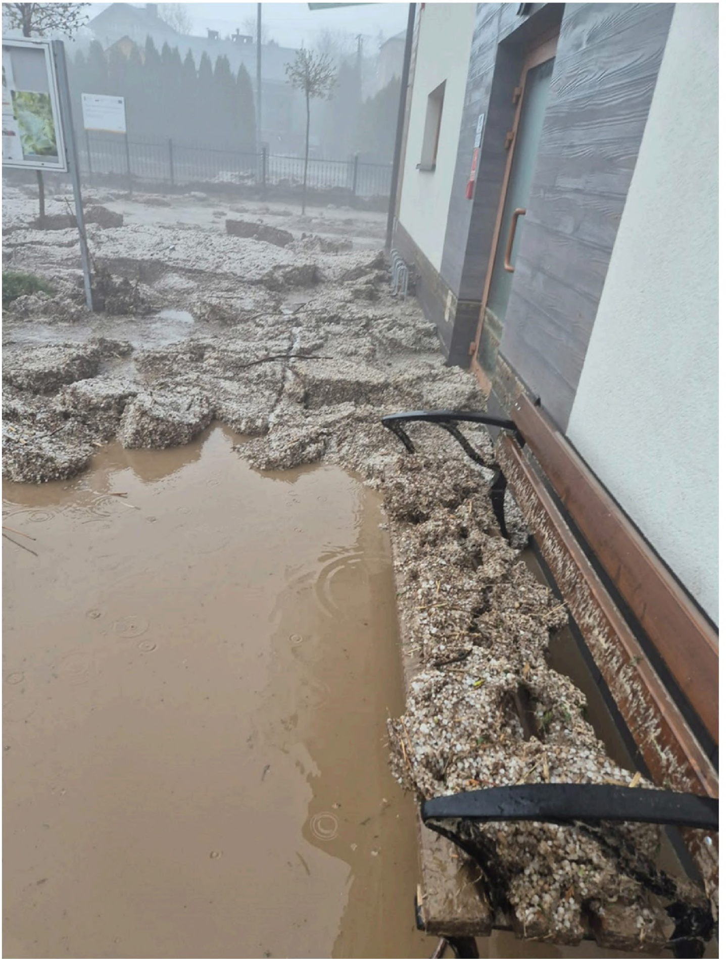
Błoto, kamienie i śmieci, które naniosła woda