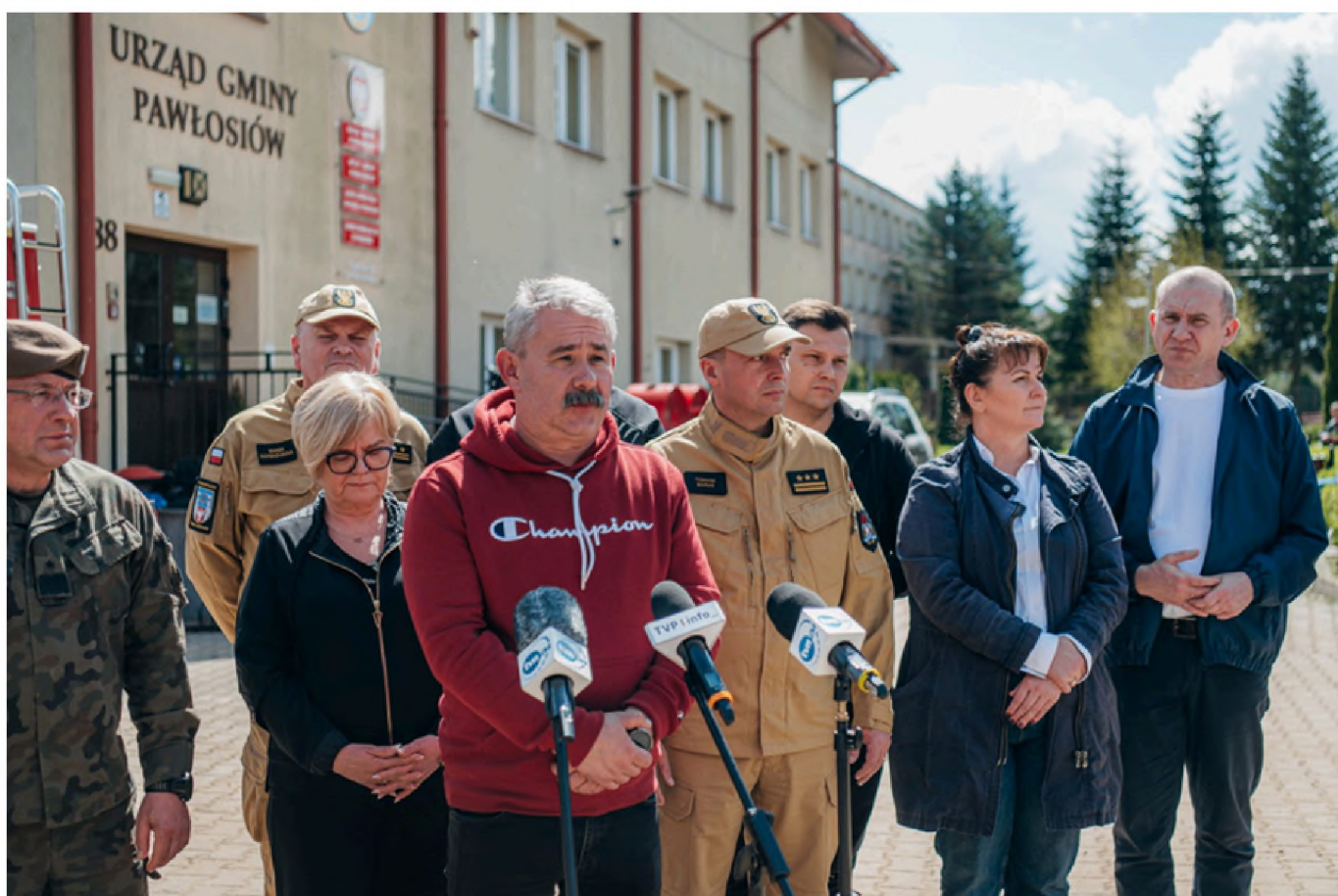
Mieszkańcy informowani o podjętych decyzjach oraz postępie prac