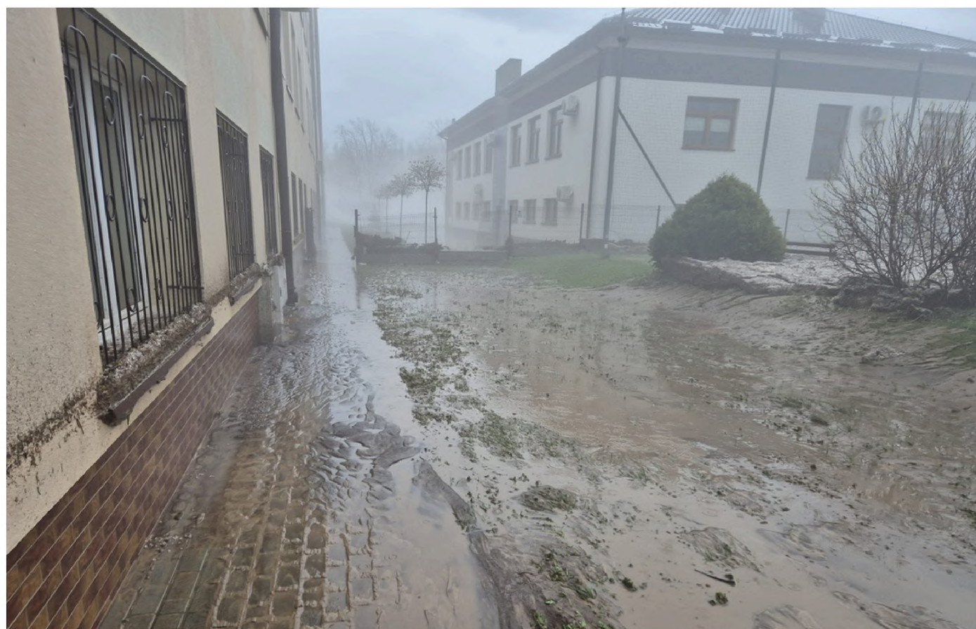
Obraz po przejściu fali powodziowej