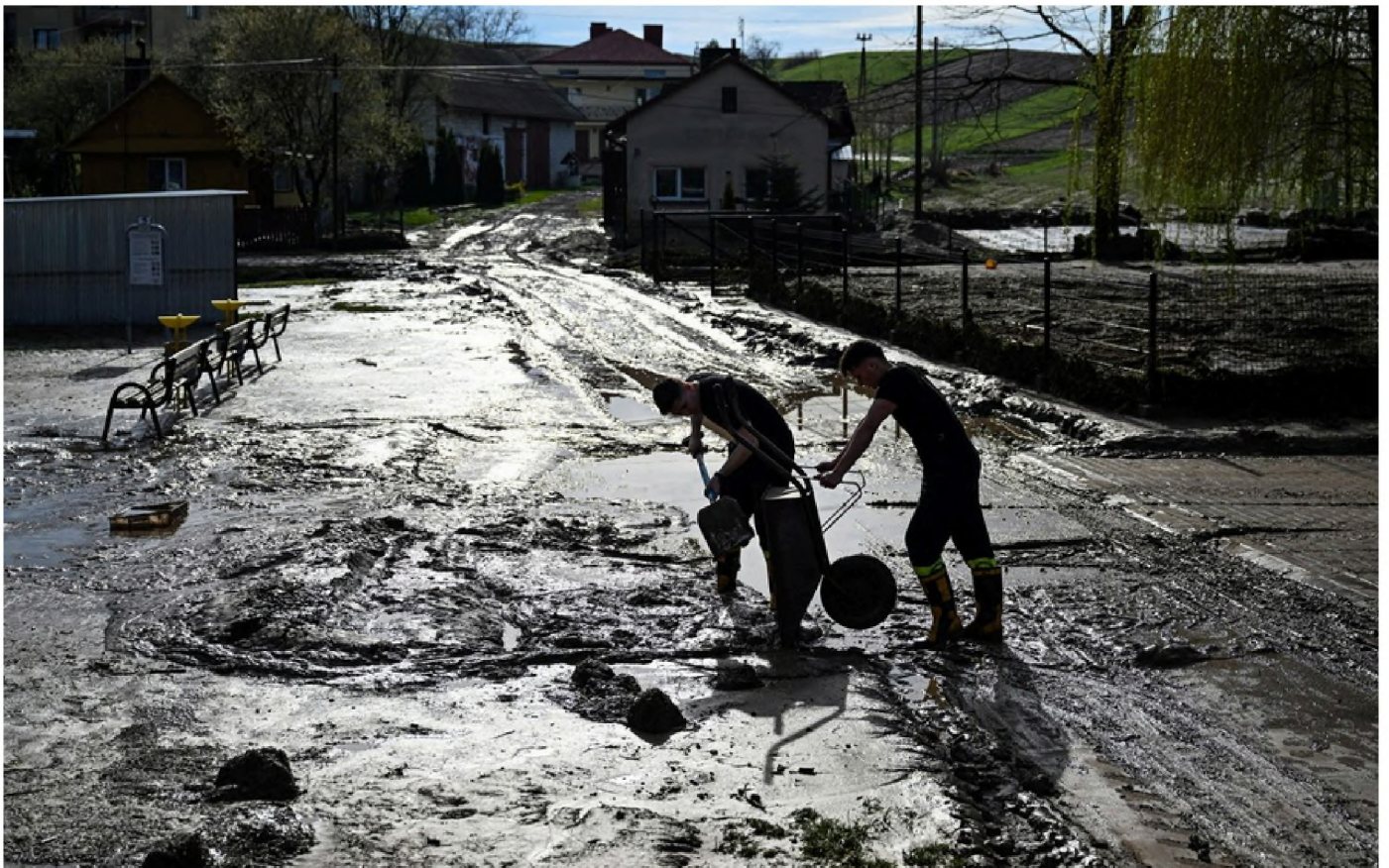
Tony mułu i kamieni