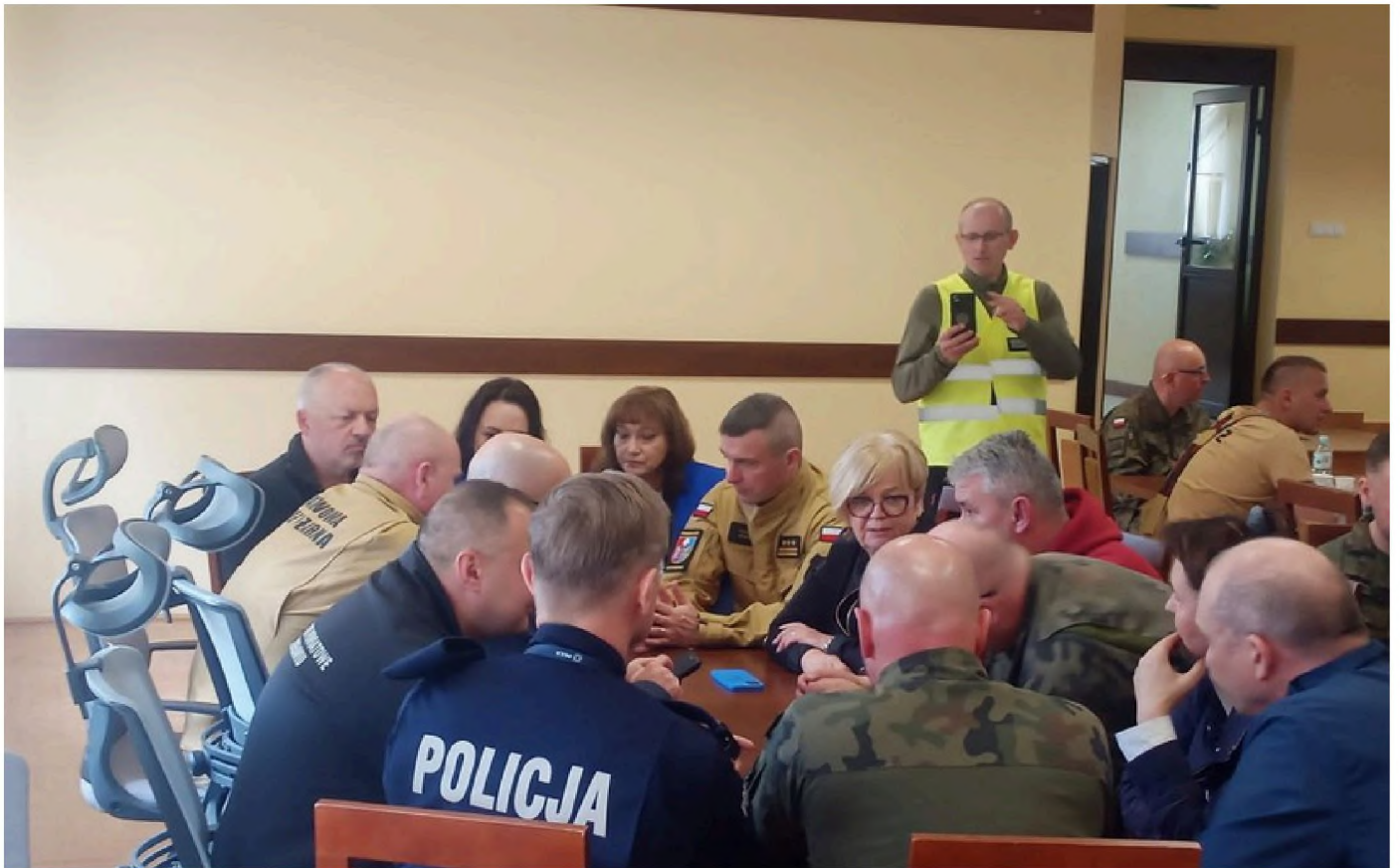
Sztab Kryzysowy tuż po powodzi