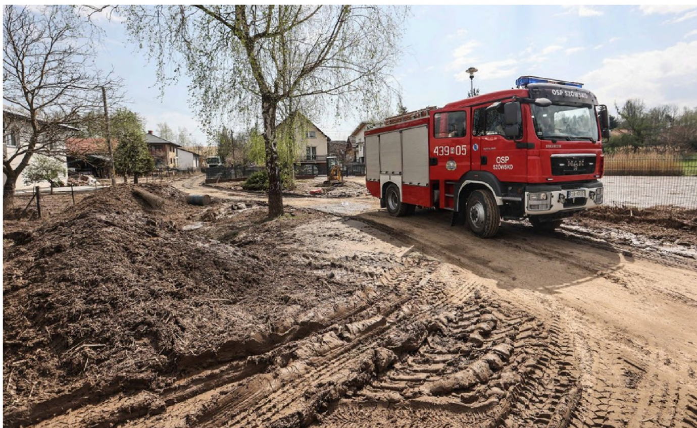
Nieoceniona pomoc zastępów Ochotniczych Straży Pożarnych