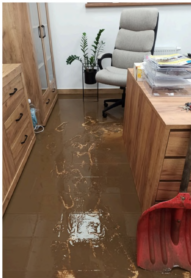
Zalane biura Centrum Aktywności Lokalnej