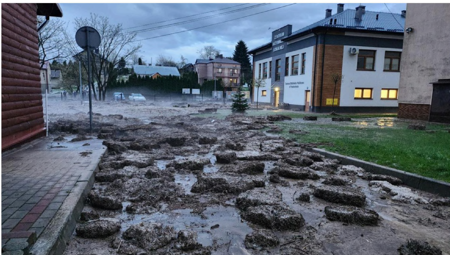
Niby znajome miejsca, ale jakże zmienione tchnieniem siły natury