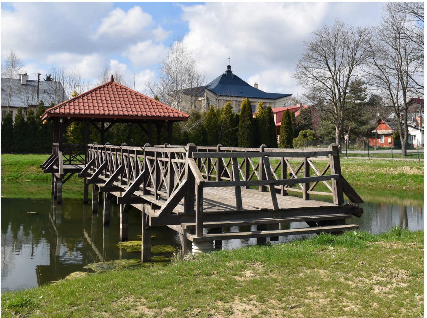
Nowe oblicze wspólnej przestrzeni