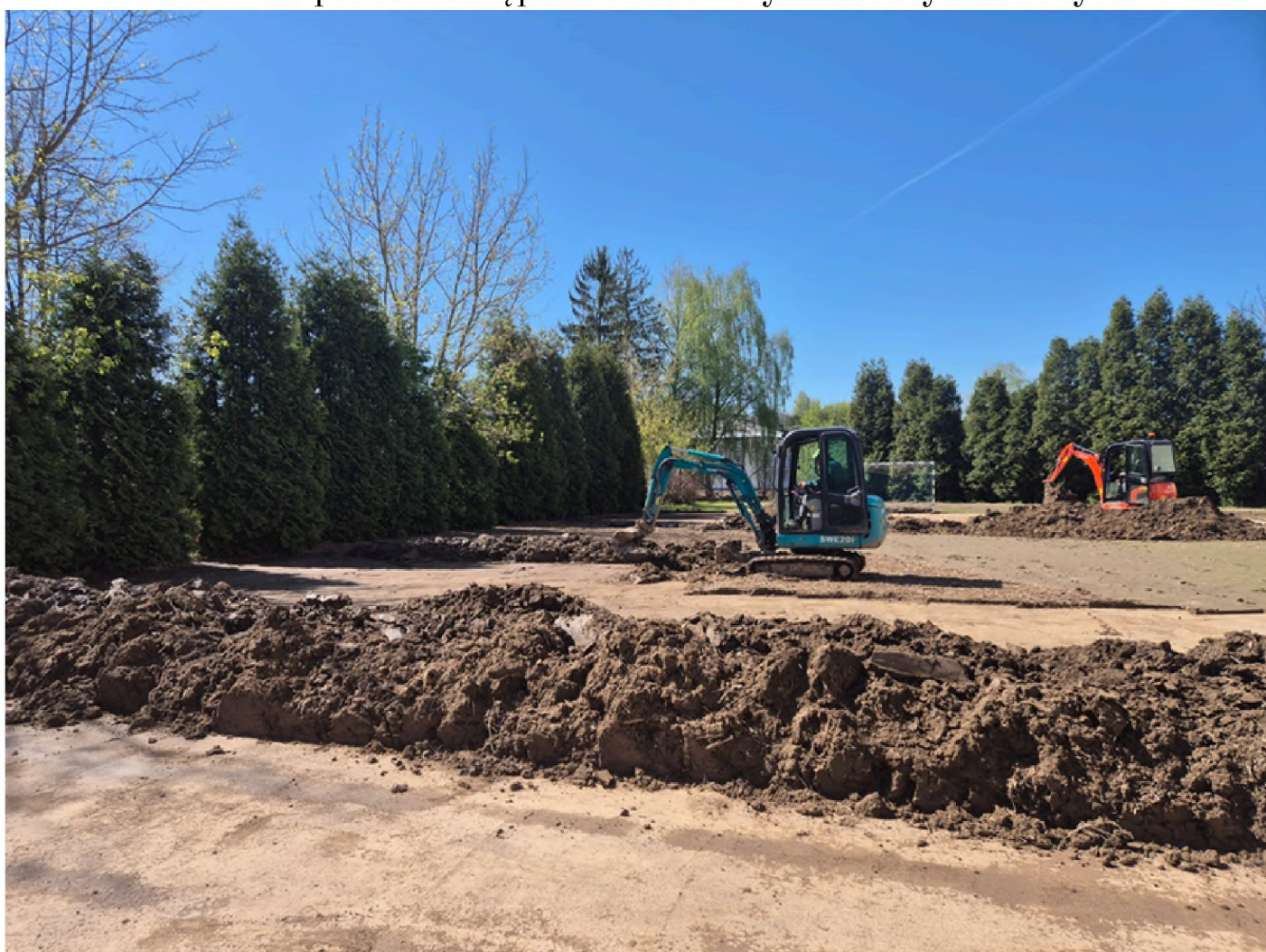
Aby przyspieszyć prace władze gminy wynajęły prywatnych przedsiębiorców z ciężkim sprzętem