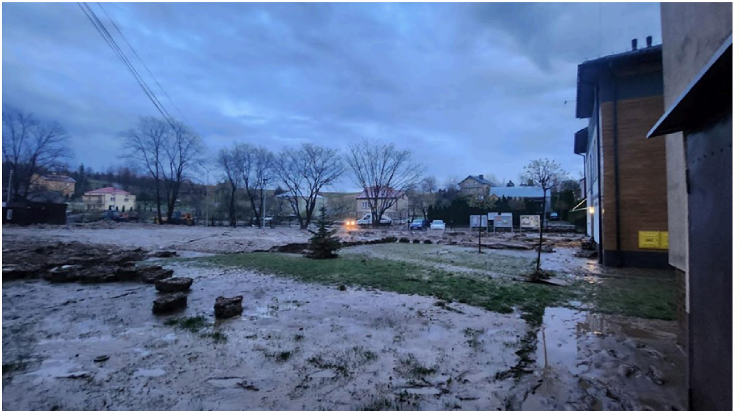
Powódź pozostawiła widoczne ślady