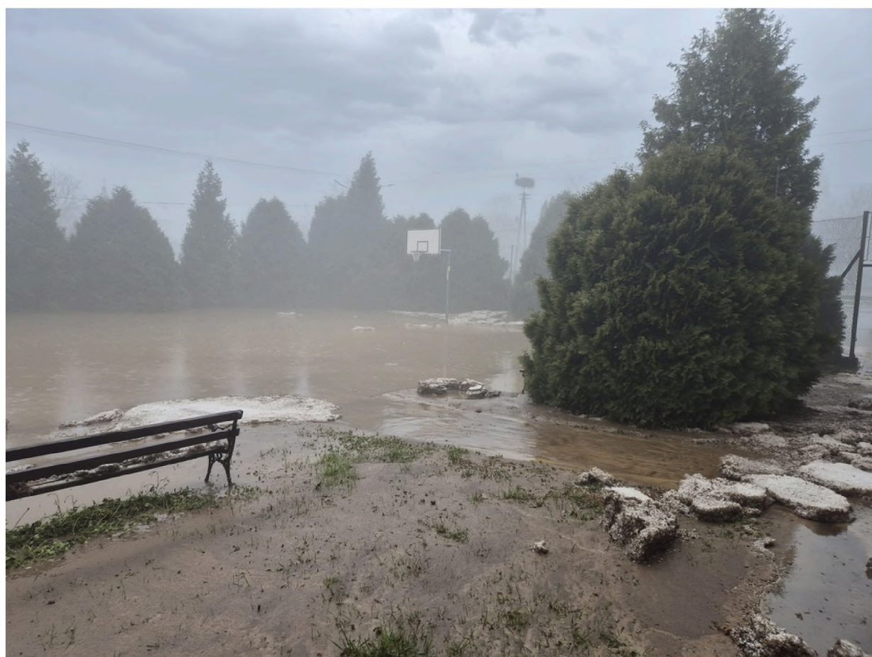
Bajoro na boisku do koszykówki