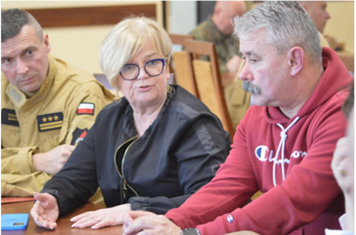
Podejmowanie najważniejszych i najpilniejszych decyzji