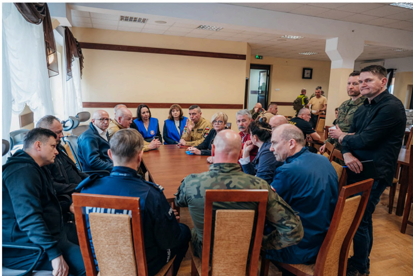
Sztab kryzysowy na parterze budynku Urzędu Gminy nie zasypiał...