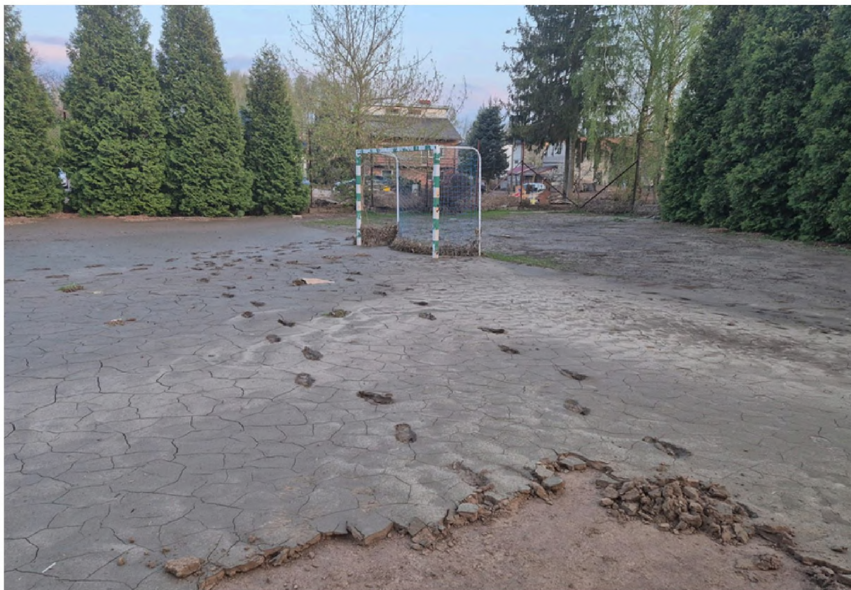
Boisko sportowe zamieniło się w grzędawisko