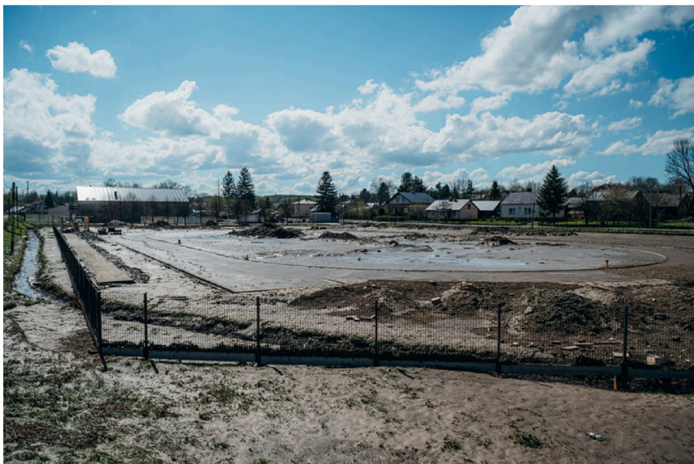
Zniszczona infrastruktura sportowa