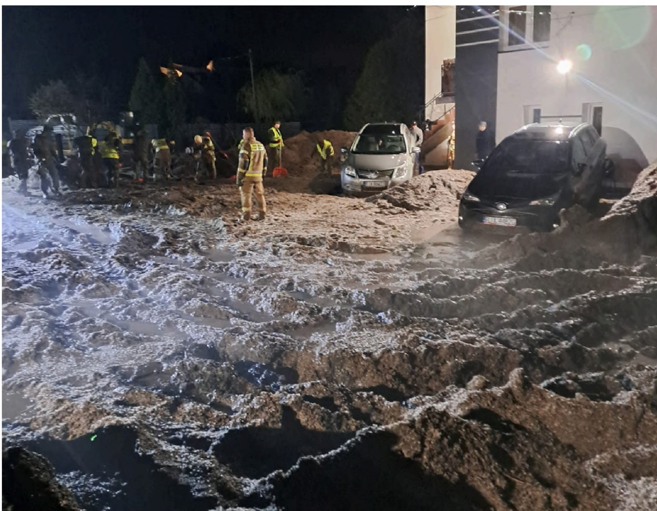
„Krajobraz księżycowy” - pierwsze godziny tragedii uchwycone w świetle reflektorów