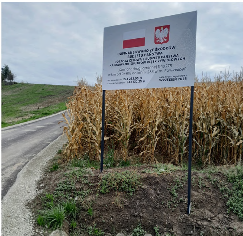
Odbudowa gminy krok po kroku