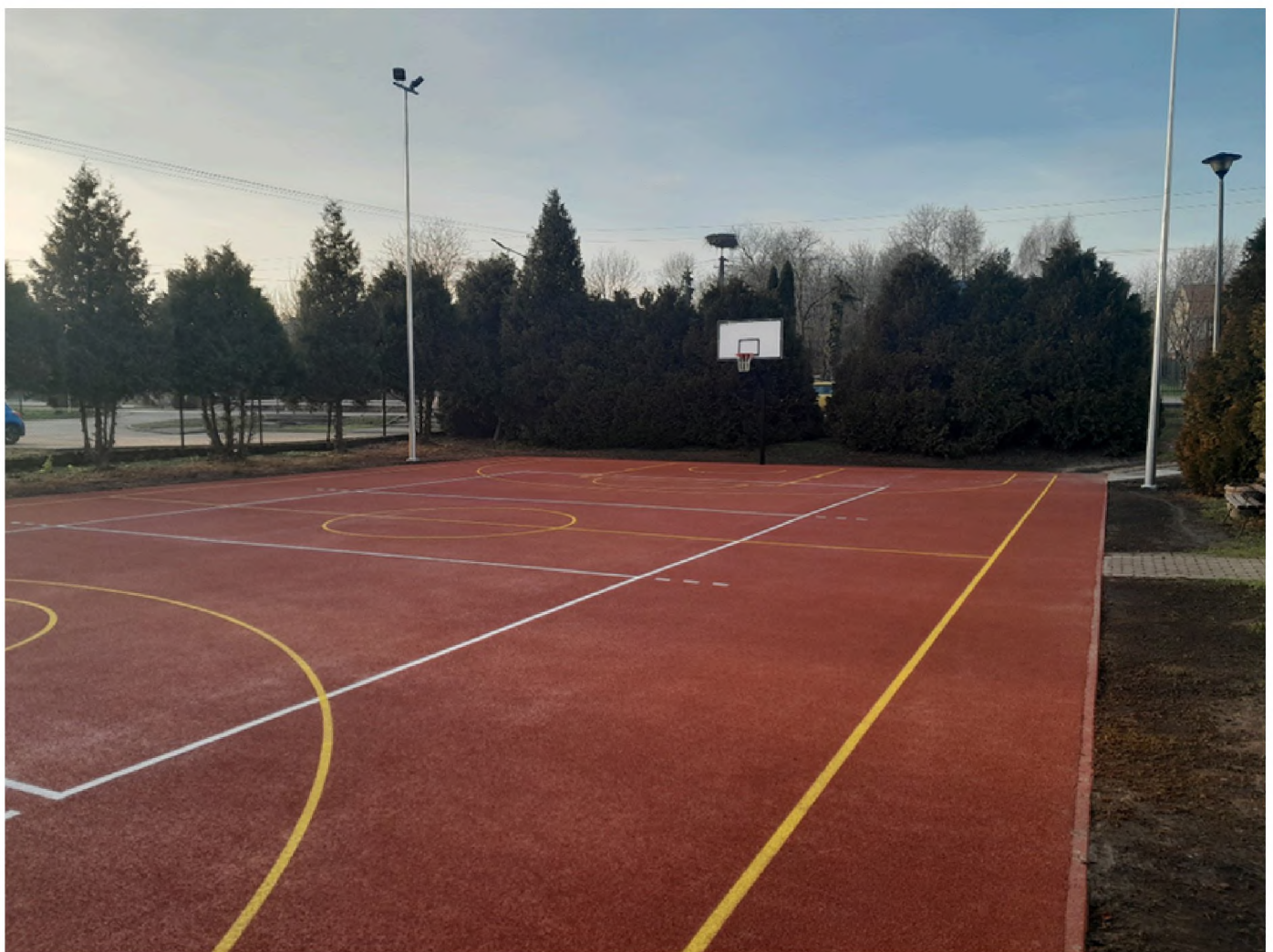
Boiska gotowe na sportowe emocje