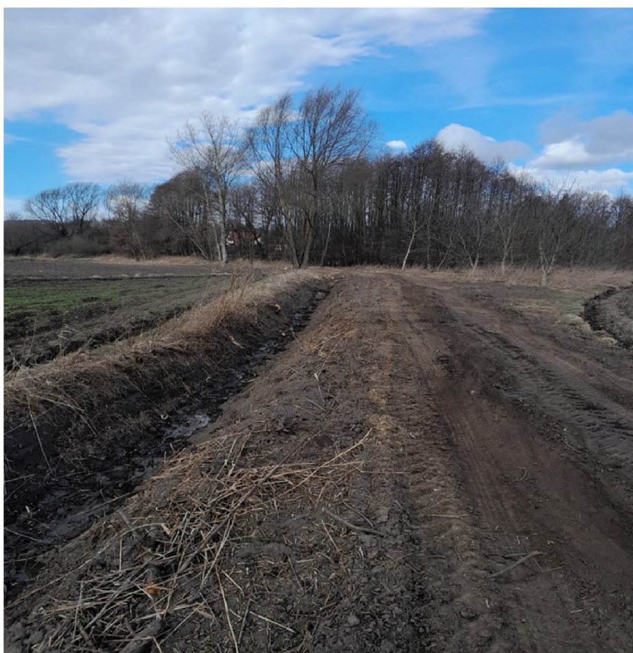
Działania Urzędu Gminy w Pawłosiowie obejmują wszystkie aspekty infrastruktury gminnej