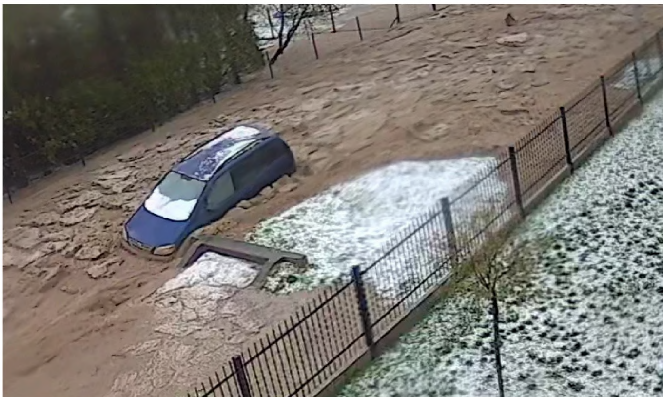
Droga zmieniona w rwącą rzekę

W Wielki Piątek, 18 kwietnia 2025 r. kilka minut po godzinie 16-tej, przez Pawłosiów przeszła nawałnica, która spowodowała gwałtowną powódź błyskawiczną. W ciągu zaledwie kilkunastu minut ulewnego deszczu i gradu, wylał niewielki potok Miłka. Zalanych zostało ponad 150 budynków mieszkalnych oraz budynki użyteczności publicznej. Błotna lawina wdarła się do piwnic, garaży i kotłowni. Tony mułu zalegały na podwórkach, drogach, placach zabaw i boiskach. W wyniku dużego naporu wody i ziemi z gospodarstw porywane były samochody, maszyny rolnicze oraz wiele innych przedmiotów znajdujących się w obejściu. To powodowało zatykanie przepustów drogowych oraz niszczenie ogrodzeń, domów i budynków gospodarczych. Niszczycielska fala wyrządziła ogromne szkody, zabierając wielu osobom dorobek życia. Nawet najstarsi mieszkańcy mówili, że tak wielkich opadów deszczu sobie nie przypominają.